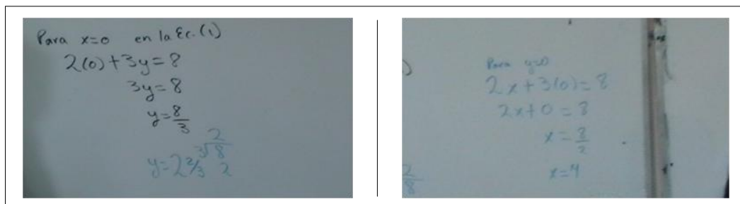
Figura 1. Proceso de igualación para obtener los puntos (x, 0) y (0, y) que corresponden a la gráfica de la ecuación 2x + 3y = 8 .